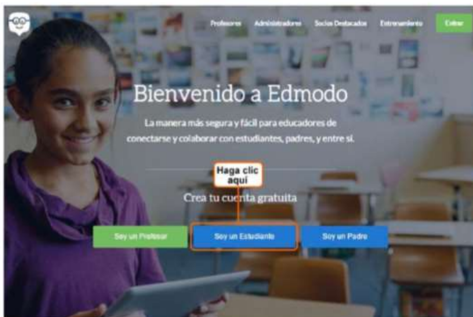
Figura 1. Crear una cuenta como estudiante.

Una vez tenga el código, ingrese a la página www.edmodo.com y haga clic en la opción Soy un Estudiante .